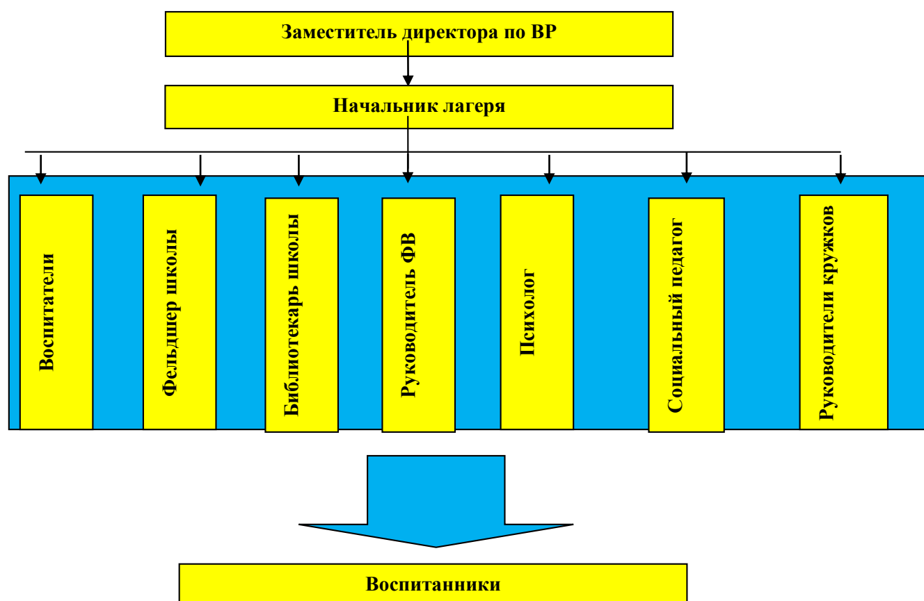
Схема управления программой